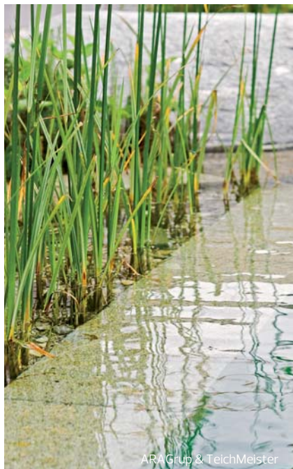
ARA Grup & TeichMeister