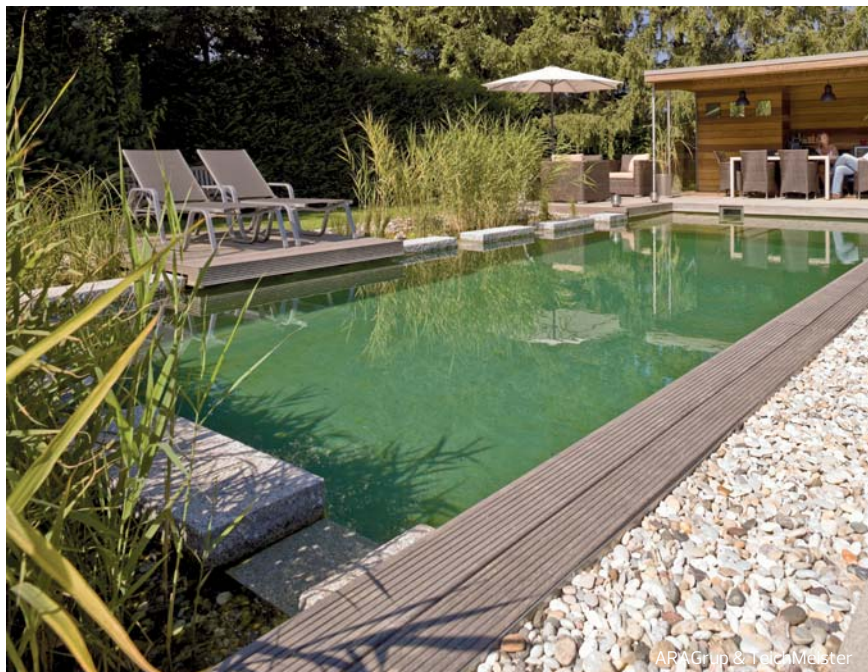
ARA Grup & TeichMeister

movimiento de nutrientes es principalmente vertical y es aplicable en lagos de baño. Lagos, porque la biología de los lagos puede usarse en superficies grandes (suele entenderse por superficie grande de zona de baño a partir de 300 m 2 ). Es importante tener en cuenta que, en depuración natural las cifras son relativas, no es como una TV que o tenemos 220 v o no funciona, por tanto, los 300 m 2 son una aproximación. La reproducción del principio de un lago es el sistema que más se acerca a la naturaleza, en el sentido que utiliza menos energía y elementos técnicos. En los lagos se desarrolla el zooplancton, que uno de sus componentes son microscópicos crustáceos capaces de filtrar más litros de agua que los filtros que entendemos por convencionales en una piscina.