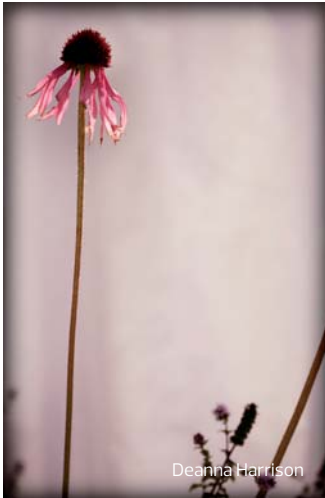
The urban physic garden. Southwark. > Londres London. Wayward Plants. 2011