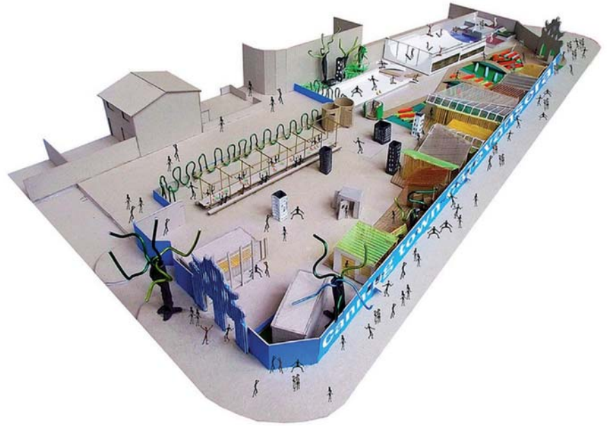
▷ Caravanserai Ash Sakula

residents, an urban community garden, play spaces, artistic workshops, a theatre and a café. The project encourages the development of facilities, workshops and other participatory events that promote the interrelationship between the residents of the neighbourhood and visitors, boosting the appropriation of space by the residents of the district.