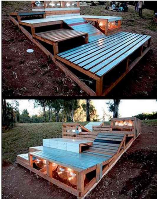
◀ Parque Via delle Palme Park