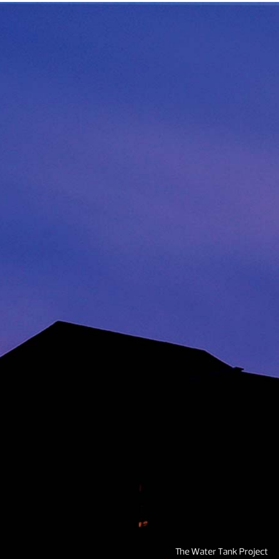
The Water Tank Project