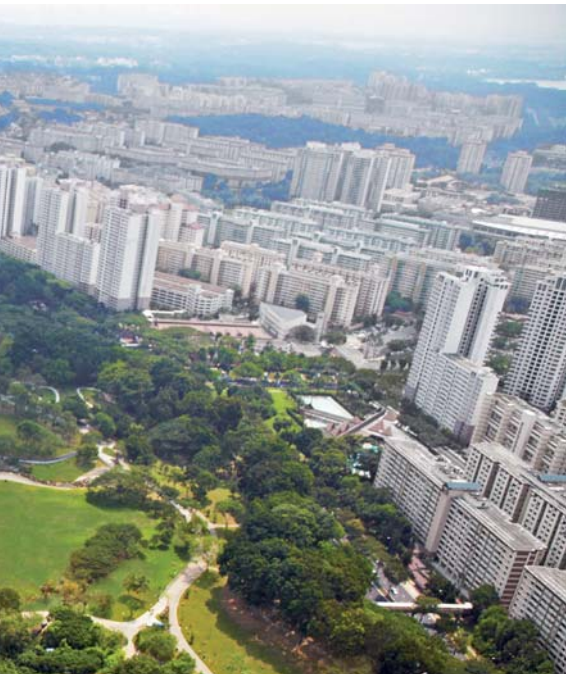
◀ Singapore Bishan Park.