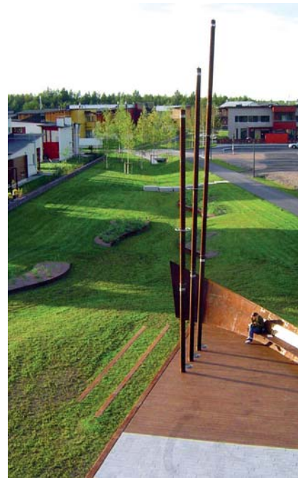
▷ Toppilansaari park. Oulu, Finlandia Finland