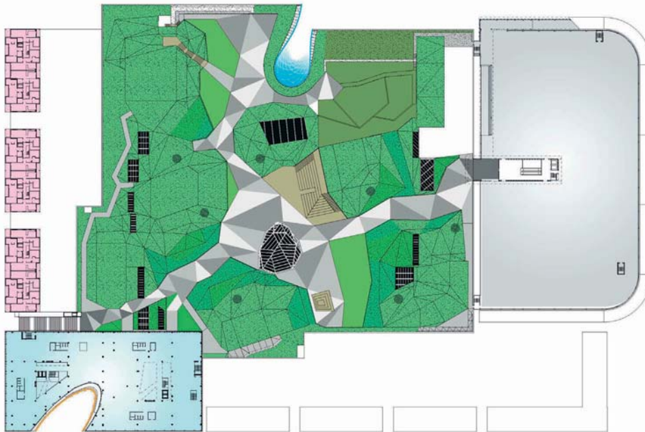
Planta propuesta para el Emporia Rooftop Park Proposal Plan Emporia Rooftop Park