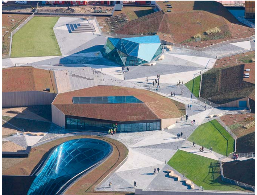
Vista del Emporia Rooftop Park ▷ View of the Emporia Rooftop Park